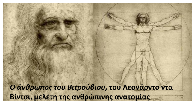
Ο άνθρωπος του Βιτρούβιου, του Λεονάρντο ντα Βίντσι, μελέτη της ανθρώπινης ανατομίας

• Ο αναγεννησιακός άνθρωπος εμπνέεται από